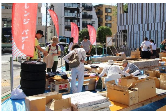
【建築資材等のバザー(自社物件開発予定地にて)】

当社は、以前より建築資材再利用を目的としたバザーの開催、自社開発物件における保育園の誘致や屋上・壁面緑化など、社会・地域・環境への貢献にむけた様々な活動を行ってきました。これらの活動内容を今一度見直し、今後は、さらに現状の社会的課題に即した取り組みに発展させて参ります。今回の推進室設置に際し、当社の CSR(企業の社会的責任)の果たす方向性を、SDGs という新たな基軸のもとに指針として掲げ、様々な社会的課題の解決による「持続可能な社会の実現」に向けて実践していきます。