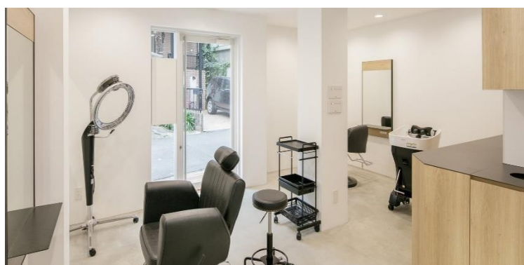
【“美容業界の新しい働き方”を提案するサロンの建設・運営】